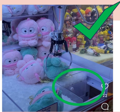
Fig 2 ตู้คีบที่มีปล่องเตี้ย