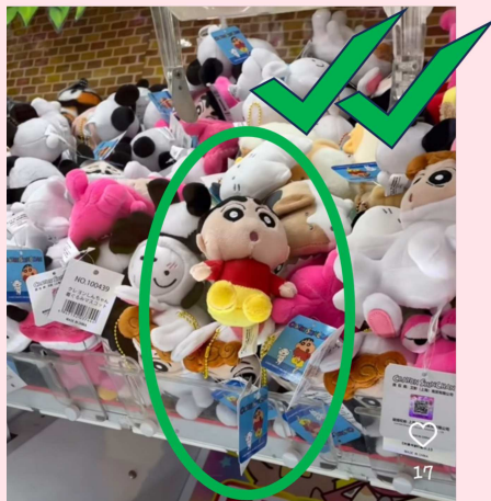
Fig 3 ตู้คีบที่ปล่องอยู่ต่ำกว่าตุ๊กตามาก ตุ๊กตาทิ้งออกมาง่าย