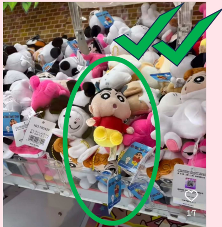
Fig 3 ตู้คิบบที่ปล่องอยู่ต่ำกว่าตุ๊กตามาก ตุ๊กตาก็ถลิ่งออกมาง่าย