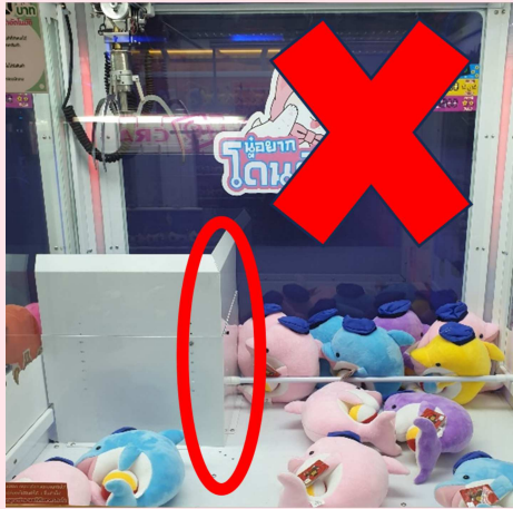
Fig 1 ตู้คิบบที่มีปล่องสูง

ถ้าปล่องเตี้ย แม้ตุ๊กตาจะลอยจากพื้นเพียงน้อยนิดก็สามารถเข้ามาได้ง่าย หรือถ้าปล่องอยู่ต่ำกว่าตุ๊กตามากๆ ตุ๊กตาก็สามารถถลิ่งตกออกมาได้เลย รูปแบบนี้จะง่ายที่สุด” เด็กหนุ่มพยักหน้าไม่หยุดนี่คือสิ่งที่มันไม่เคยสังเกต ส่วนใหญ่มันจะคิดว่า คิบบเพราะอยากได้เมื่อกดปุ่มแล้วก็ได้แต่สวดภาวนาให้ขาคิบบคิบบได้แน่นพอแค่นั้น “ต่อไป คำว่า คิบบ” ครานี้ชายชราคิดว่าคำว่าคิบบ แล้วโยนขึ้นฟ้า