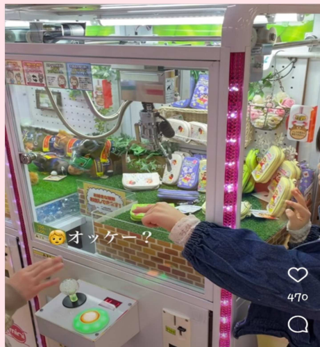
Fig 4 ตู้ที่อยู่หัวมุม จะสามารถมองได้หลายมุม