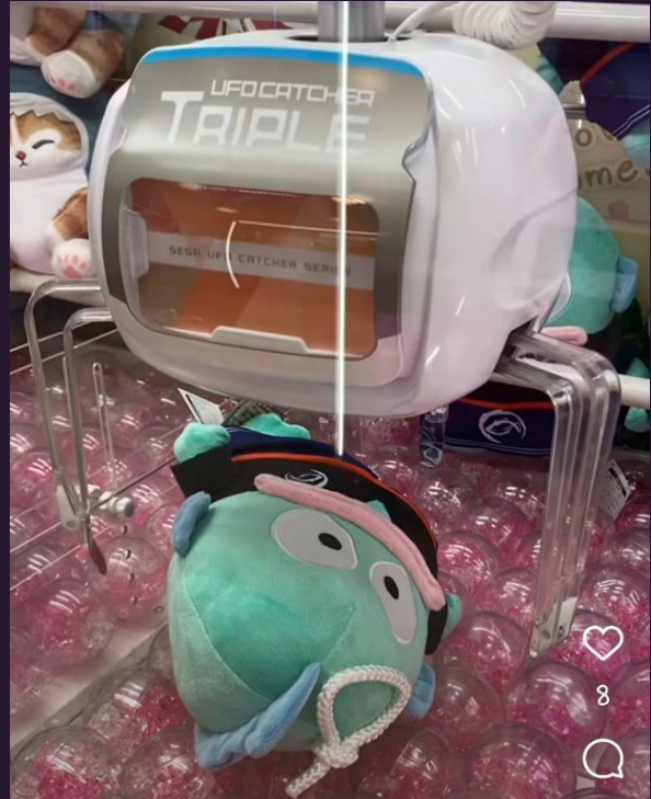
Figure 5 ชาคิบบแบบ UFO Catcher ไม่สามารถ หนีบหรือแหว่งได้ จะเคลื่อนที่ขึ้นลงเท่านั้น