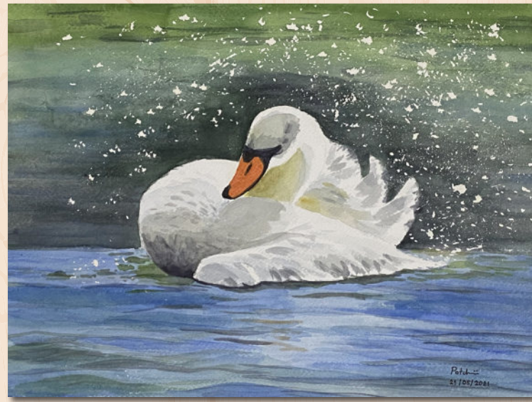
Fig 3 ภาพสีน้ำ วาดตามขั้นตอนใน YouTube Channel: Yong Chen

❁ 7. หากใครพก tablet อยู่แล้ว มีความคุ้นเคยกับการใช้งาน ก็อาจจะวาดแบบ digital ลงทุนแค่ซื้อปากกากับ application เช่น Procreate (เฉพาะ iOS), Adobe Illustrator ในแอปจะมี brush ให้เลือกใช้ หาซื้อ brush เพิ่มเติมได้ด้วย สีแล้วแต่จะจิ้มเลือก แก้ไขง่ายเพราะกด undo ได้ แยก layer ได้ งานรูปแบบ digital สามารถนำไปปรับใช้ได้หลายทาง เช่น ทำสติ๊กเกอร์ไลน์ หรือผลิตเป็น ชิ้นงานต่าง ๆ ได้สะดวก