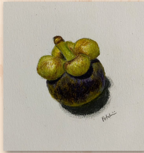
Fig 2 ภาพสีไม้ วาดโดยดูต้นแบบวัตถุจริง

❁ 6. อุปกรณ์ สี และกระดาษ มักแบ่งคุณภาพเป็น 3 เกรด คือ student, studio และ artist ของที่เราเคยใช้สมัยเด็กอาจจะเป็นเกรด student สีน้ำผสมแบ่งเยอะสีไม่สวย ใช้กระดาษร้อยปอนด์ระบายแล้วบวม วันนี้เป็นทันตแพทย์มีกำลังทรัพย์ ก็ซื้อของที่มีคุณภาพขึ้นได้ แนะนำว่า ให้ซื้อของดีแต่ไม่ต้องซื้อปริมาณมาก ขอให้แน่ใจว่าซื้อมาแล้วจะ ได้ใช้ เพราะของบางอย่างเก็บไว้นานก็เสื่อมสภาพ เช่น สีอะคริลิก ส่วนฟุ้งกันก็เหมือนแปรังสีฟุ้ง ใช้นาน ๆ ก็ปลายบานต้องเปลี่ยน ซื้อตุนไว้ไม่เป็นไร แต่ต้องเป็นแบบที่ตรงกับเทคนิคที่จะวาด