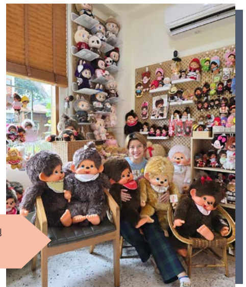
ผู้เขียนกับม่อนซี้ไฮสปีดที่รอให้มาทุกคน กอดที่ Caterpillar Café