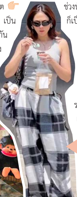
แม่ชมพูห้อยน้องกระดูกกลวง IG

ช่วงมี.ค.-ส.ค.67 เป็นช่วงที่กระแสมอนชิแรงมาก ราคาในไทยของมอนชิขนาดเริ่มต้น SS (พวงกัญแจ) หรือ S (ตุ๊กตา) อยู่ที่ประมาณ 1500 บาทขึ้นไป เอามาขายเมื่อไหร่คนก็แย่งซื้อแย่งเอาพจนหมด พ่อค้าแม่ค้าคนไทยบินไปเหมาตามร้านที่ญี่ปุ่นจนเกลี้ยงแผง ถึงขนาดที่ร้านหลายแห่งในญี่ปุ่นต้องเขียนเป็นภาษาไทยว่าจำกัดการซื้อ 1 ตัว/คนเท่านั้น ใครที่เข้าวงการในช่วงนั้นหมดเงินกันไปเยอะมากเลยทีเดียว (ผู้เขียนก็เป็นหนึ่งในนั้น 555) แต่ในช่วงนี้เริ่มมีการ restock หลาย ๆ collection และบริษัทน่าจะผลิตจำนวนมากขึ้น ทำให้ราคา resale ของรุ่นที่ไม่ใช่ Limited ในไทยเริ่มถูกลง บางตัวที่เคยขาย 3-4 พันบาท ตอนนี้ก็กลับมาราคาพันต้น ๆ แล้ว พวงกัญแจราคาไม่ถึงพันก็หาซื้อได้แล้ว ดังนั้นใครเพิ่งเริ่มเข้าวงการตอนนี้ถือว่าเป็นช่วงเวลาที่ดีมาก 😊