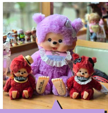
3 Limited Collection ของมีขายเฉพาะที่ฮ่องกง ตัวสีม่วงมีแค่ 300 ตัว ตัวสีแดงมี 600 คู่ ถ้าไปลานจะซบหัวและมีเสียงเพลงด้วย

จริง ๆ แล้วมีนักสะสมชาวไทยหลายท่านที่สะสมมอนชิมาอย่างยาวนาน แต่ก็เป็กลุ่มเล็ก ๆ ไม่ได้ดัง ปังแบบตอนนี้ สาเหตุที่มอนชิมา hot ในไทยขนาดนี้น่าจะเป็นเพราะ Fashion icon ชมพู-อารยา เอฮาร์เก็ต ➡ เอามาท้อยกระเป่าและถ่ายลง Instagram หรือ IG อย่างต่อเนื่อง เป็นที่รู้กันว่าถ้าตัวไหนชมพูห้อยปูป ราคาตัวนั้นจะพุ่งปรืด และตามหากันจ้าละหวั่นแบบเดียวกับที่ลิซ่าถือ labubu เลย ขอยกตัวอย่างเช่น พวงกัญแจตัวโครงกระดูกสีขาว ตอนแรกทาง่ายขายกันอยู่ที่ 1500-1600 บาท แต่พอชมพูห้อยปูป กลายเป็นราคาขึ้นไปเกือบ 4000 บาท และหายากไปเลย