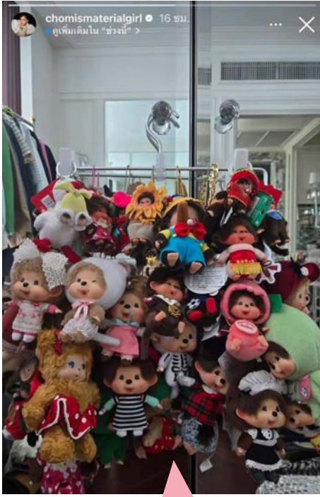
รวมตัวห้อยกระเป๋าของชมพู อารยา