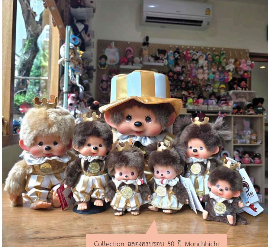
Collection ฉลองครบรอบ 50 ปี Monchhichi และ 20 ปี Bebichhichi

สิ่งหนึ่งที่น่าจะทำให้ม่อนซี้ยังอยู่ในกระแสอย่างต่อเนื่องคือ บริษัท ขยันออก Collection ใหม่มีากกกก ทำให้มีน้องๆแบบใหม่ๆมากระตุ้นความ ออยากอยู่เสมอ โดยในบทความนี้จะลงรูป collection ที่น่ารักมาให้ดูเป็น แนวทางเผื่อใครจะเริ่มเข้าวงการนี้บ้าง ข้อควรระวังสำหรับผู้เข้าวงการใหม่ คือ ระวังของปลอมที่มีราคาถูกกว่ามาก ซึ่งคนขายเองที่ขายตามกระแสยังไม่รู้ ด้วยซ้ำว่าเป็นของปลอม วิธีดูคือของแท้จะต้องเขียนว่า Monchhichi สำหรับ ตัวผู้ใหญ่ หรือ Bebichhichi สำหรับตัวเบบีและมีป้าย Sekiguchi อยู่ด้วย (แต่ถ้ารุ่นเก่า ๆ จะไม่มีป้ายนี้) และไม่ต้องตกใจถ้าเขียนว่า made in China เพราะตอนนี้น้องม่อนซี้จะผลิตที่จีน และมี Collection พิเศษที่ขายเฉพาะที่ ฮองกงด้วย ถ้าซื้อม่อนซี้ที่ญี่ปุ่น จีน ฮองกง จะมีแต่ตัวไม่มีกล่องแดง แต่ไม่ต้องงง ถ้าเจอแบบใส่กล่องแดง แสดงว่าน้อง ๆ บินมาจากยุโรป โดยข้างกล่องจะเขียน Monchhichi.eu ส่วนของปลอมนั้น ส่วนใหญ่จะมีหน้าขาวๆและดูไม่ ละมุนเท่า และต้องสังเกตชื่อดี ๆ เพราะถ้ามองเผิน ๆ ป้ายของปลอมจะคล้าย ป้ายของจริงมาก แต่ของปลอมจะเป็นชื่ออื่นเช่น Mengqiqi หรือ Monmonichi หรือเอาป้าย Bebichhichi ไปติดที่ตัวผู้ใหญ่ และมักจะไม่มีป้าย Sekiguchi อยู่ด้วย จริง ๆ ถ้าใครเคยเห็นของจริงมาก่อนจะรู้ได้จากสีผิวที่จะมีมิติไม่ ขาวโพลน สัดส่วนหน้าจะไม่ดูแปลก ๆ ความนิ่มของขน และความเรียบร้อย จะแตกต่างกันอย่างเห็นได้ชัด แต่ถ้าใครยังไม่ม่อนซี้มาก่อน และอยากรู้ว่า ของจริงน่ารักแค่ไหน ขอเรียนเชิญมาที่ Caterpillar Café ของผู้เขียนที่อยู่ ที่ชอยงามวงศ์วาน 2 เพื่อสัมผัสความน่ารักของน้องก่อนตัดสินใจว่าจะเข้า วงการนี้หรือไม่คะ 😊