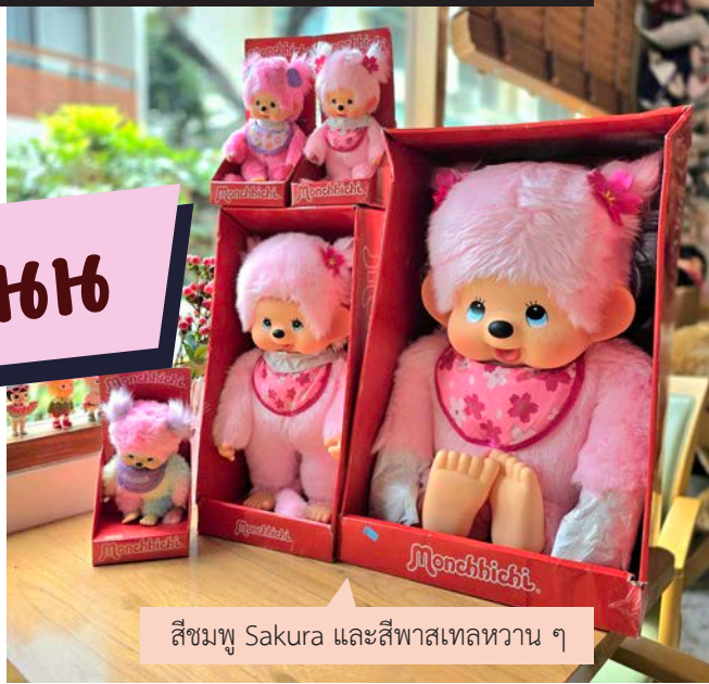
สีชมพู Sakura และสีพาสเทลหวาน ๆ

ท่ามกลางกระแสความโด่งดังของ art toys หรือกล่องสุ่ม ที่มีมากมายหลายแบบ เช่น Labubu Molly หรือ Cry baby เจ้าลิงน้อยหน้าตาน่าเอ็นดูที่ชื่อ Monchhichi ก็ได้รับความนิยมไม่น้อยไปกว่ากัน ผู้เขียนเชื่อว่าหลาย ๆ ท่านที่เห็นเจ้าลิงตัวนี้น่าจะมีความรู้สึกเดียวกันว่าทำไมถึงหน้าคุ้น ๆ เหมือนเคยเห็นตอนเด็ก ๆ มาก่อน ซึ่งก็เป็นอย่างนั้นจริงๆ เพราะเจ้าลิงน้อยที่คนไทยเรียกกันว่า มอนจี้จี้ มอนกี้กี้ มอนชิชิ หรือเรียกสั้น ๆ ว่า “มอนชิ” นั้นมีอายุครบ 50 ปีแล้วนะ